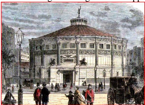
Cirque Napoléon, Paris