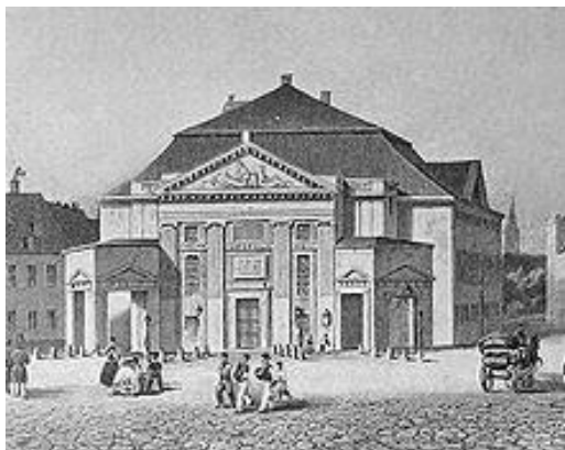
Det kgl. Theater, København