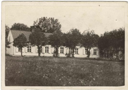
Dalen prestegård.